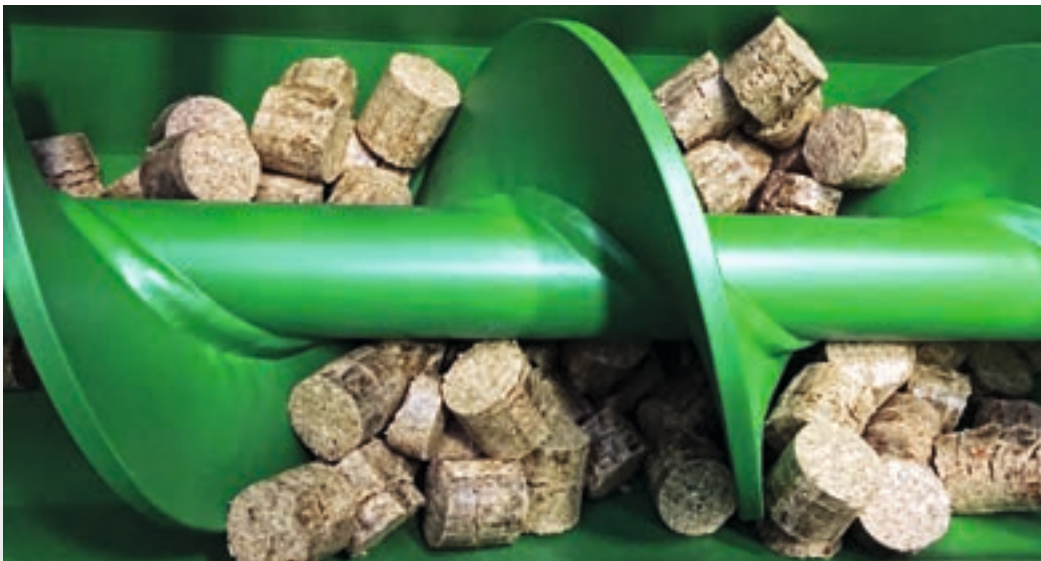
Förderschnecke mit Briketts der Briklet Presse

Technische Änderungen vorbehalten - Durchsatzleistungen abhängig von dem Ausgangsmaterial